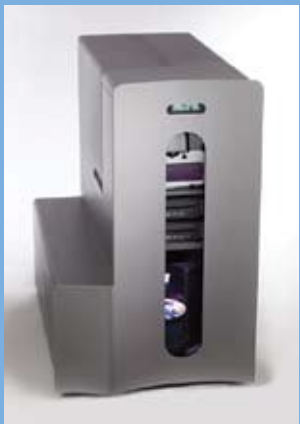
使用技术先进的 Rimage CD/ DVD/BD 自动光盘印刷刻录机