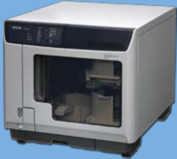
EPSON Discproducer PP100 / PP100N CD/DVD 光盘印刷刻录机